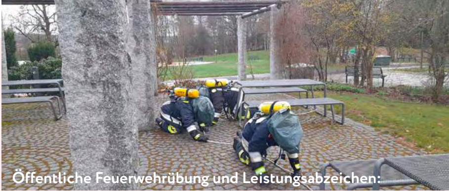
Öffentliche Feuerwehrübung und Leistungsabzeichen: